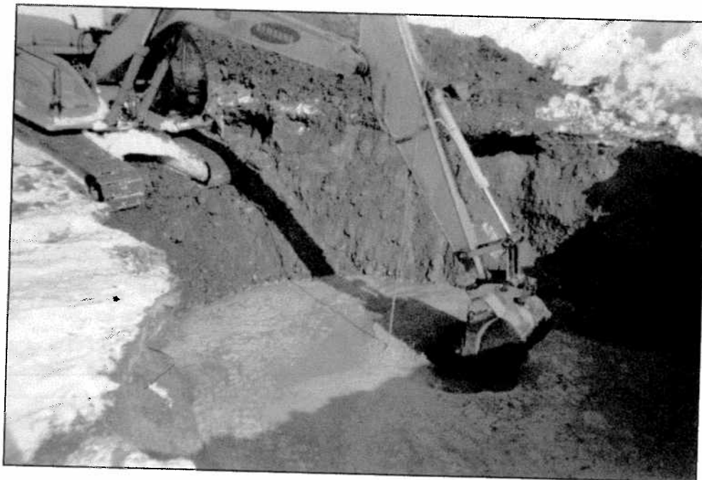
Photographie 2. Tranchée exploratoire réalisée en février 2006.