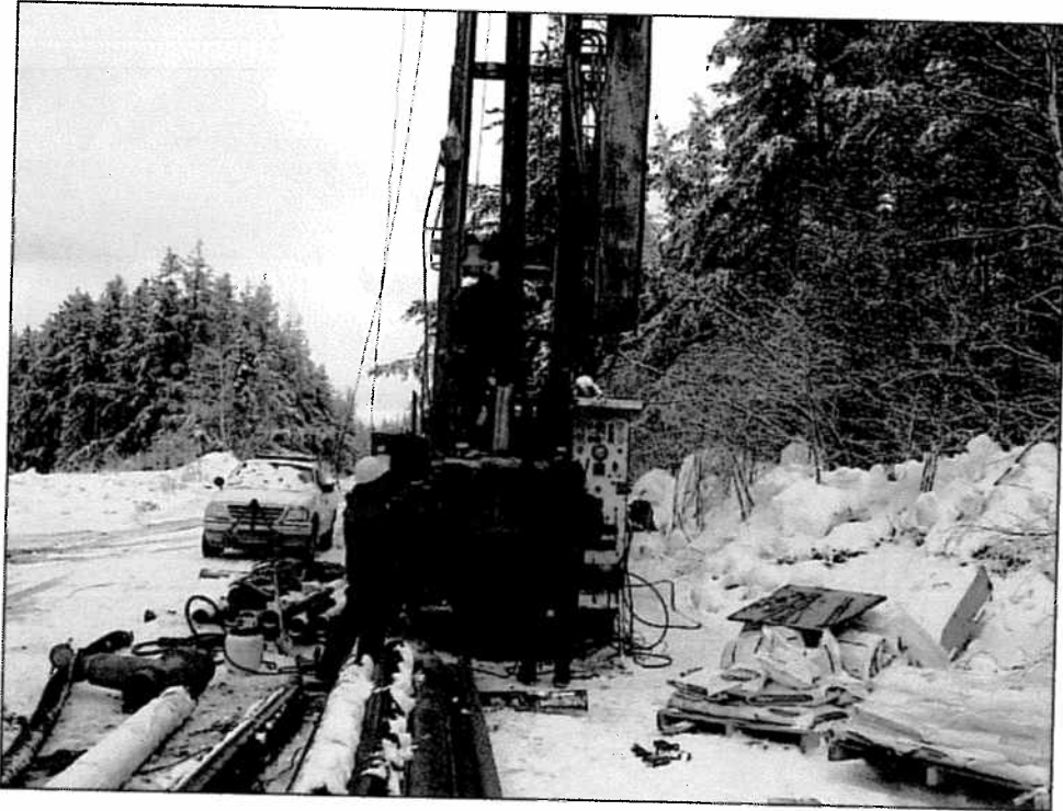
Photographie 3. Aménagement du puits PP-6 en avril 2006.